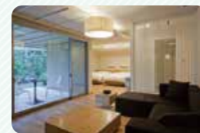
ホテル内唯一の離れであるセントラルヴィラ