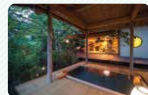
専用露天風呂はのびのび体を伸ばせるゆとりの広さ

客室となる11棟の離れに巡らされた広縁からは、15万坪の敷地に数十万本の木や花々が咲き誇る庭園が望めます。専用露天風呂付きで気兼ねなく浸かれるのが魅力。有田焼や伊万里焼の器が、地元・佐賀の山海の幸を贅沢に使った懐石料理を引き立てます。