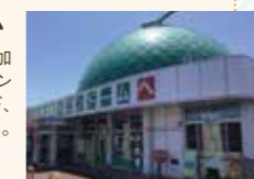
客室の外に広がる田園風景にも癒やされます

☎ 0968-25-5757 住 熊本県菊池市七城岡岡田306 時 9時～18時、レストラン:10時～14時 休 1月1日～3日 定 263台(無料)