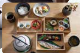
朝食では八女茶のお茶漬けも楽しめます

人との接触を減らしながらのんびりしたい、温泉や食事を安心して部屋で満喫したい。コロナ影響下での新しい旅にふさわしい、離れや専用露天風呂がある「おこもり」宿をご紹介します。「ステイケーション」や「ワーケーション」の場としての利用も可能です。