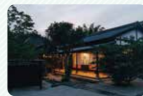
建物には、現代の建築物にはない風情が