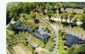
客室の外に広がる田園風景にも癒やされます

☎ 0968-24-6600 住 熊本県菊池市森北字白金 2016-1 料 1泊1名26,400円(2名利用時/入湯税別途1名150円)ほか 時 チェックイン15時、チェックアウト翌12時 休 不定休 定 10台(無料) URL https://www.shirokane-mori.jp