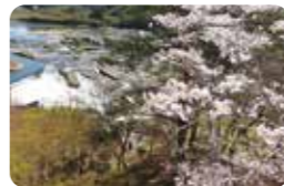
力強い自然の姿を見ることができます