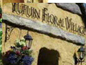
魔法使いがほうぎに乗ってやって来そう!

☎0977-85-5132 住 大分県由布市湯布院町川上1503-3 入場料無料、一部施設有料