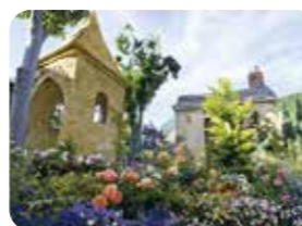
パーク内は季節の花々に彩られ気分も華やきます