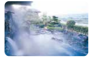
眺望も素晴らしい露天風呂で美肌の湯を堪能できます