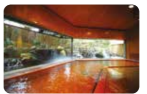
素晴らしい庭園を眺めながら“美肌の湯”が癒やしてくれる大浴場