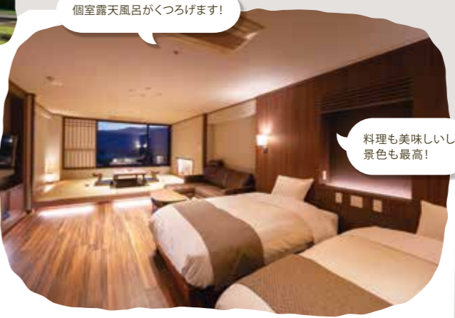
料理も美味しいし景色も最高!