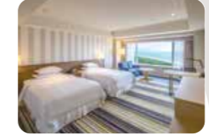
ゆとりの広さのツインルーム。空と海をイメージした明るい客室が魅力です