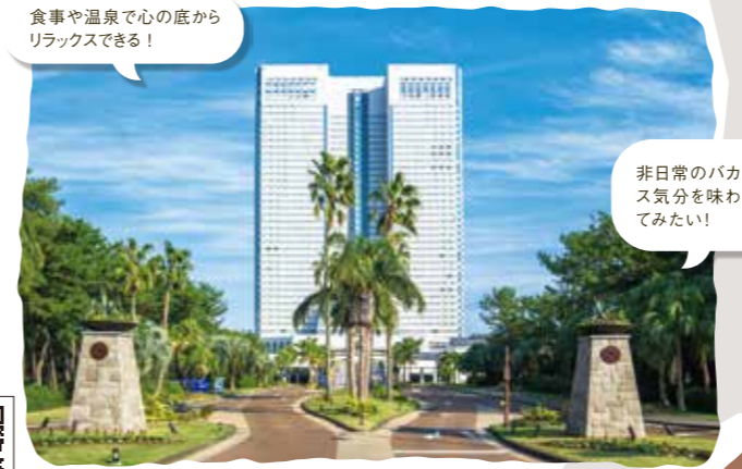
非日常のバカンス気分を味わってみよう!