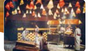
別府の温泉街の賑わいが体感できる夜の館内