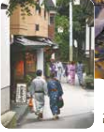
入湯手形を懐に浴衣と下駄で温泉街をそぞろ歩き