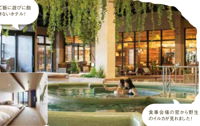
食事会場の窓から野生のイルカが見えました!