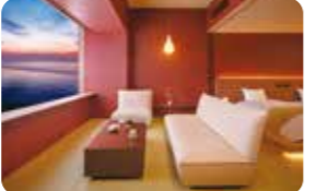
界の魅力の一つ「ご当地部屋」。別府温泉の血の池地獄から着想を得て柿渋色で彩られています