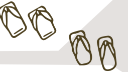
木々に囲まれ、いろんな旅館があるのが面白い!